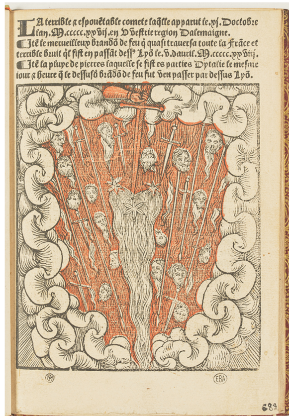
La terrible et épouvantable comète , 1528, Paris, BENSBA, Fonds Masson, n° 682, f° 1 (© École nationale supérieure des beaux-arts, Paris. Photo. Thierry Ollivier).