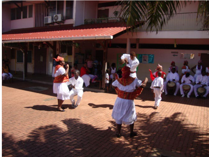
Ex. 5. Quelques pas de nika , jeunes danseurs groupe Wapa, 2012

Les cavalières viennent, quant à elles, enrichir le nika avec les koutren . Elles se distinguent par la capacité qu'elles ont de tenir en haleine leurs partenaires. Parfois en robe kanmza 9 (jupon blanc ou foulard piqué sur la poitrine ou encore bout de tissu noué à la hanche par-dessus un autre vêtement), elles usent des bras, jambes, et hanches pour alterner balancements ( balansé ) et tournoiements ( tournen-viré ), tout en exécutant des allers-retours ( palaviré ), accompagnés d'ondoiements. Puis, elles peuvent, en douceur, se rapprocher de leurs cavaliers pour ensuite s'en écarter rapidement. Elles donnent aussi des coups de reins, de ventre et de hanches. C'est ainsi qu'elles participent au pavwézé , dodiné (simulacre de séduction).