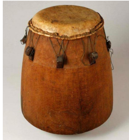
Ex. 4. Apinti doon (tambour apinti ), photographié en 2007 à l'occasion d'une levée de deuil ( puu baaka ), à Loka

instruments de musique, dont je relève ici des caractéristiques spécifiques qui relient les Bushinenge à leurs environnements spirituel et naturel. Il s'agit surtout de trois tambours traditionnels ( gaan doon , pikin doon et tun : grand tambour, petit tambour et tambour-métronome), qui servent aux usages cérémoniels ou rituels, en particulier pour des cérémonies de deuil ou des prières spécifiquement destinées aux ancêtres et aux divinités. Ces instruments accompagnent également toutes sortes de chants et danses. À l'intérieur de ce trio tambourinaire, le gaan doon sert de tambour-maître. Il joue le solo avec des parties improvisées. Dans le contexte des cérémonies rituelles liées à des prières aux ancêtres ou aux divinités, ce tambour change de dénomination et devient alors tambour apinti ou apinti doon (ex. 4).