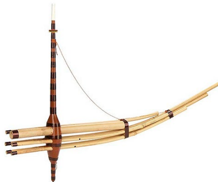
Ex. 3. L'orgue à bouche qeej , 2011 Cet aérophone appartient à M. René Lau Fai Neek, du village Cacao

Pour évoquer cette réalité, la musique du qeej me servira d'illustration. Cet orgue à bouche est, par ailleurs, l'instrument de musique hmong par excellence (ex. 3).